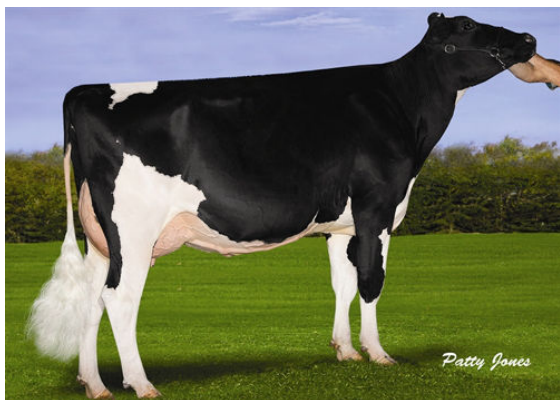
SANDY-VALLEY ATWD BRADY THIRD DAM