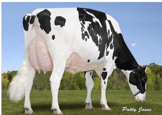
WALNUTLAWN DOORMAN BREANNA GRANDDAM