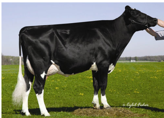
REGANCREST BRYNNA FOURTH DAM